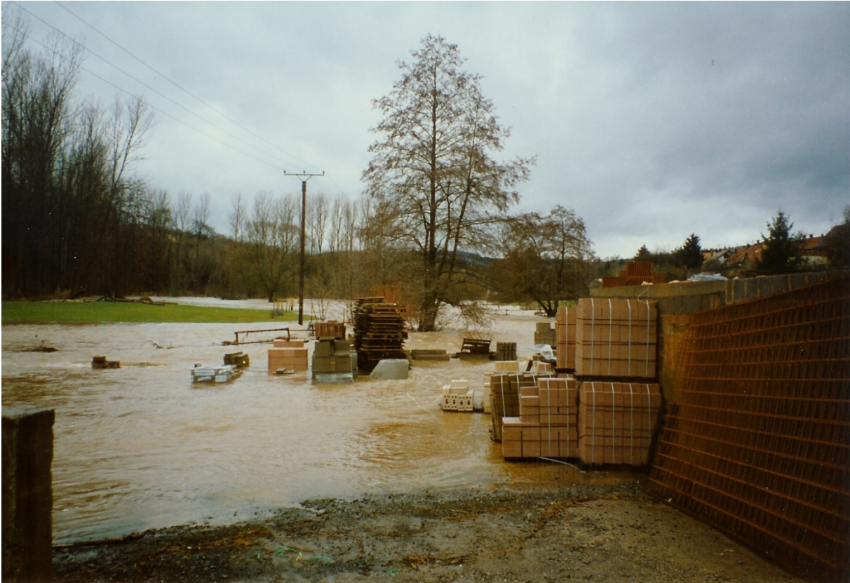
Unsachgemäße Lagerung in Überflutungsbereichen