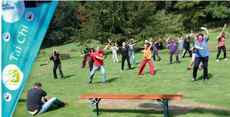
Tai Chi am VHS-Stand während des Saarländischen Lernfestes