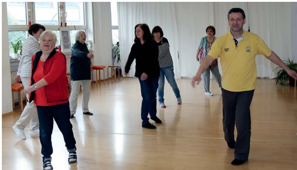
VHS-Kurs: Tai Chi für Senioren