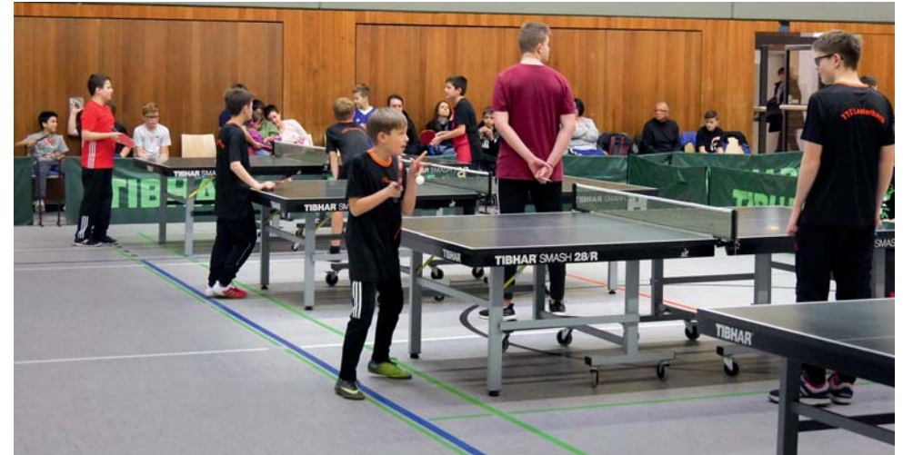
Minimeisterschaft mit dem TTC Lauterbach