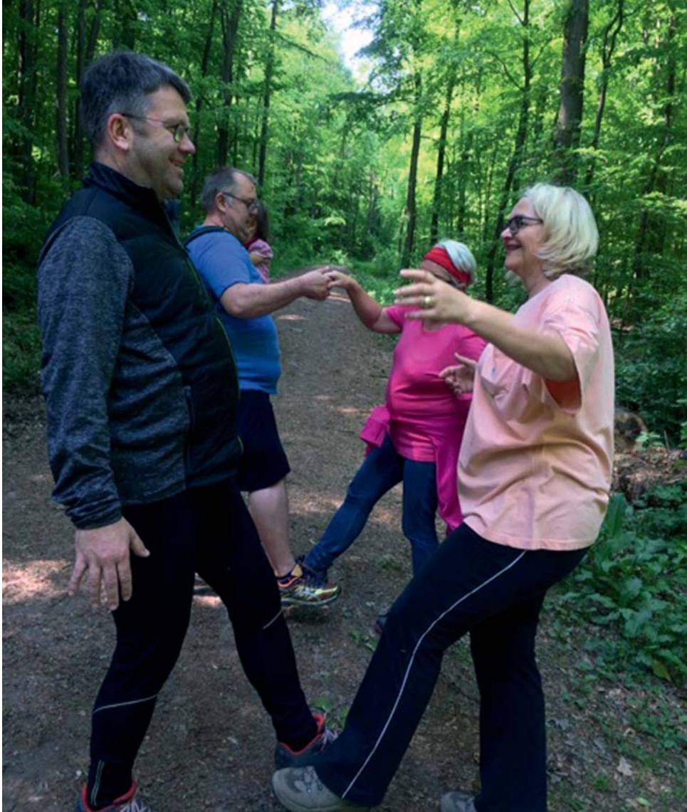
Gesundheitswandern mit der Physiopraxis Becker