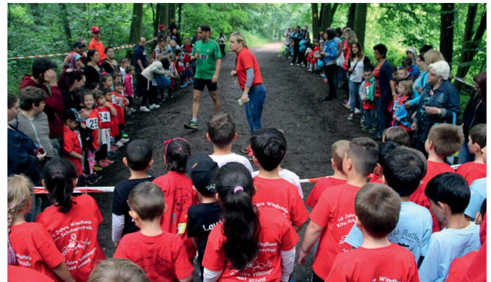
10. Kita-Waldlaufmeisterschaften der Kita Schubertstraße